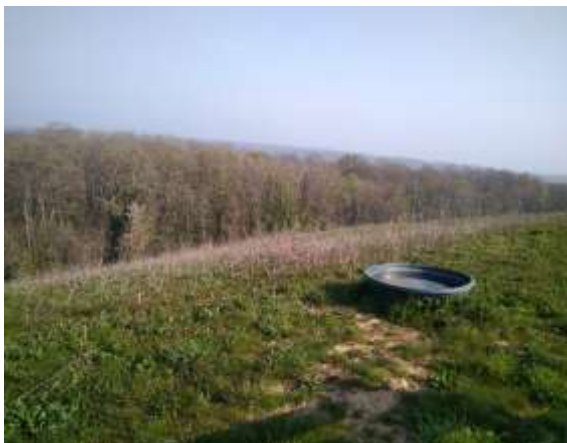
Figure 3 : intérieur de l'enclos 3