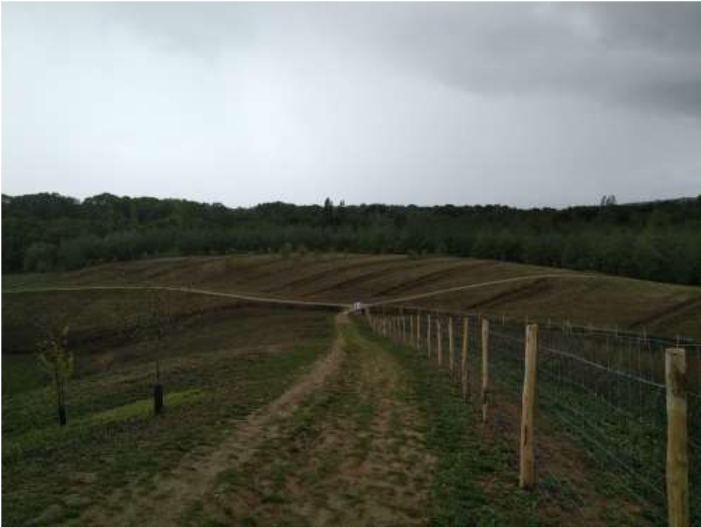
Figure 5 : Verger en pente à gauche, enclos 3 à droite et enclos 4 au 2 nd plan