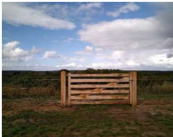
Figure 4 : portail de l'enclos 3