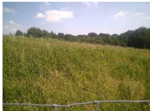
Figure 2 : intérieur de l'enclos 2