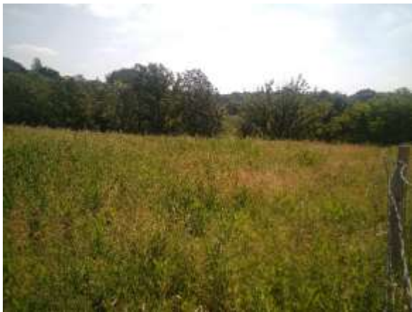
Figure 1 : intérieur de l'enclos 1

Les enclos 1, 2 et 3 sont accessibles par voie carrossable de 3,5 m de large (environ 10 m à parcourir entre la limite de voie et les enclos). L'enclos 4 est en revanche accessible uniquement via un chemin en grave de 1,5 m de large ou via un chemin en terrain naturel en forte pente.