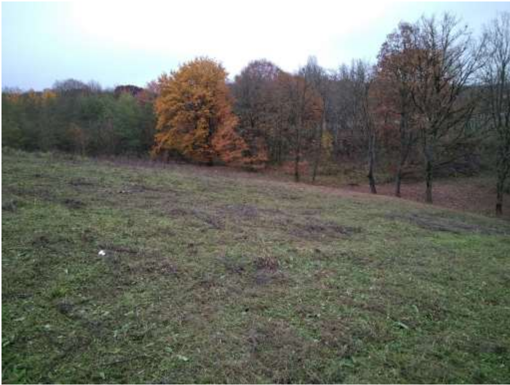
Figure 4 : pâture de l'enclos 2