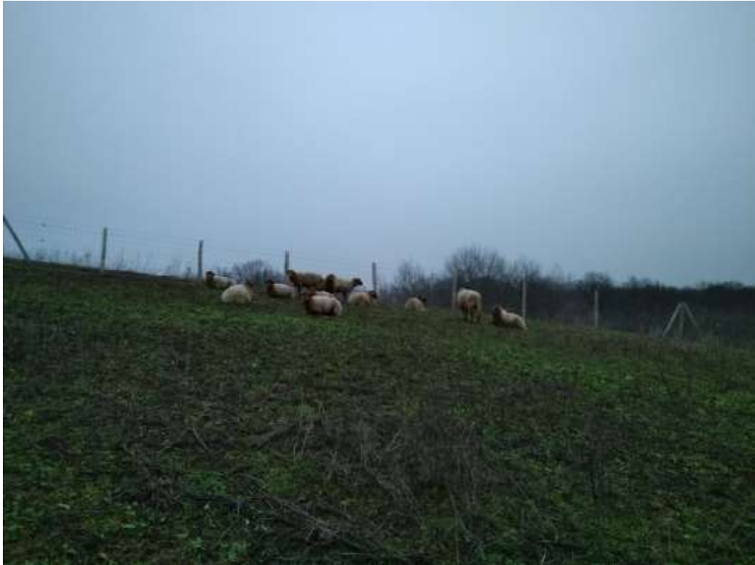
Figure 8 : enclos pâturé