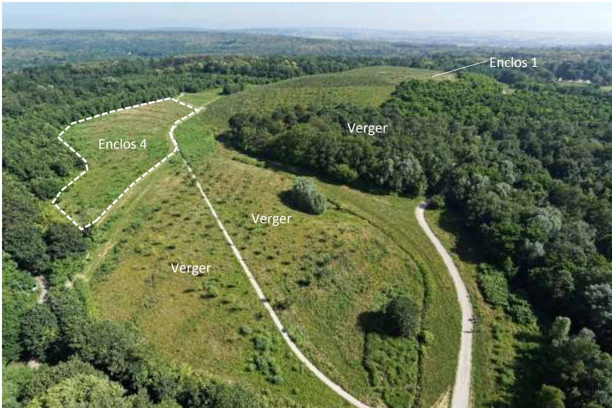
Figure 6 : Photo aérienne de l'entrée au Sud-Ouest du site