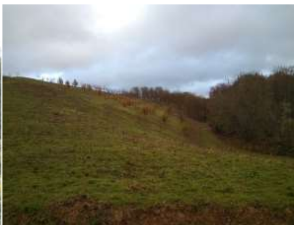
Figure 6 : verger en pente après la taille