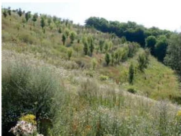
Figure 5 : verger en pente avant la taille

Enfin, il est à noter que ces vergers sont accessibles librement au public et l'un d'eux est situé en forte pente.