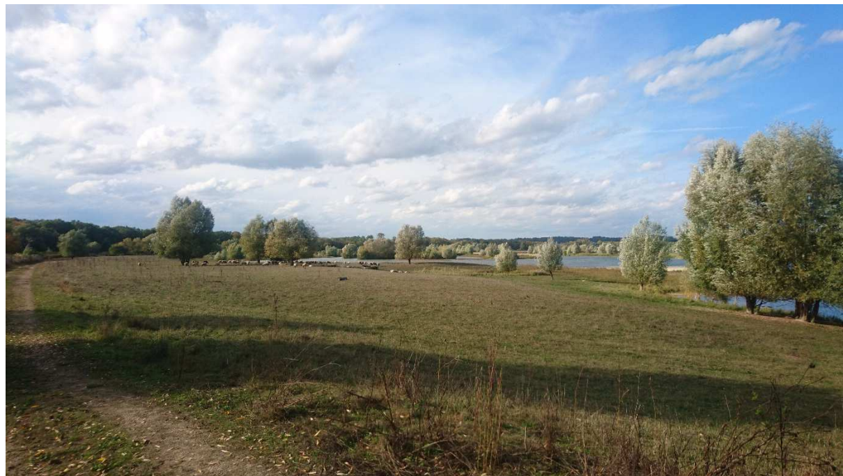
Figure 1 : pâture